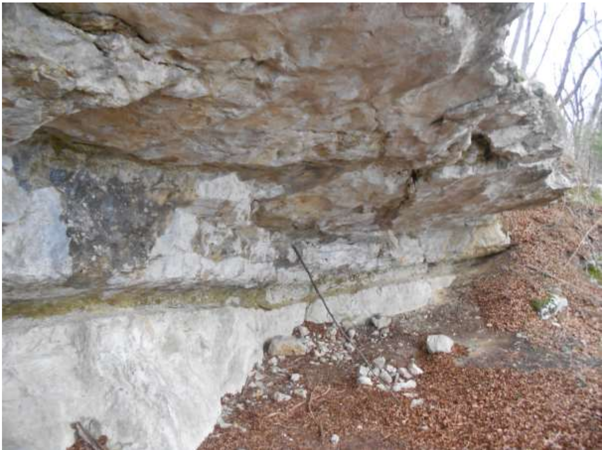
Slika 1: Votla peč – skalni previs na Homcu

Na našo vasico je počasi, a vztrajno začel naletavati sneg, a le-ta ni preprečil naše radovednosti o fosilih na Homcu, v kraju Žiče. V mrzlem in vetrovnem vremenu smo se odpravili na Homec- Žičko gorco. Izvotlitev Votla peč med domačini že nekaj časa buri domišljijo in vzbuja dvome o nastanku. Skrivnostnost omenjenega spodmola pa smo pod drobnogled vzeli tudi mi.