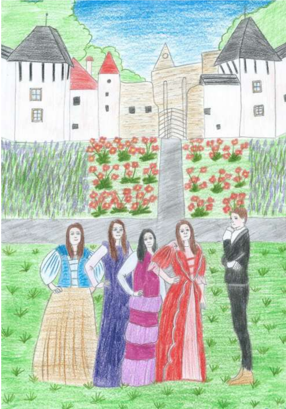
Slika 5: Otokar III. in njegova žena Kunigunda (tretja iz leve) v spremstvu spletičen pred vhomom v samostan

(Risba: Utrinki iz fotografiranja izpod spretnih rok Primoža Lovrenčiča)