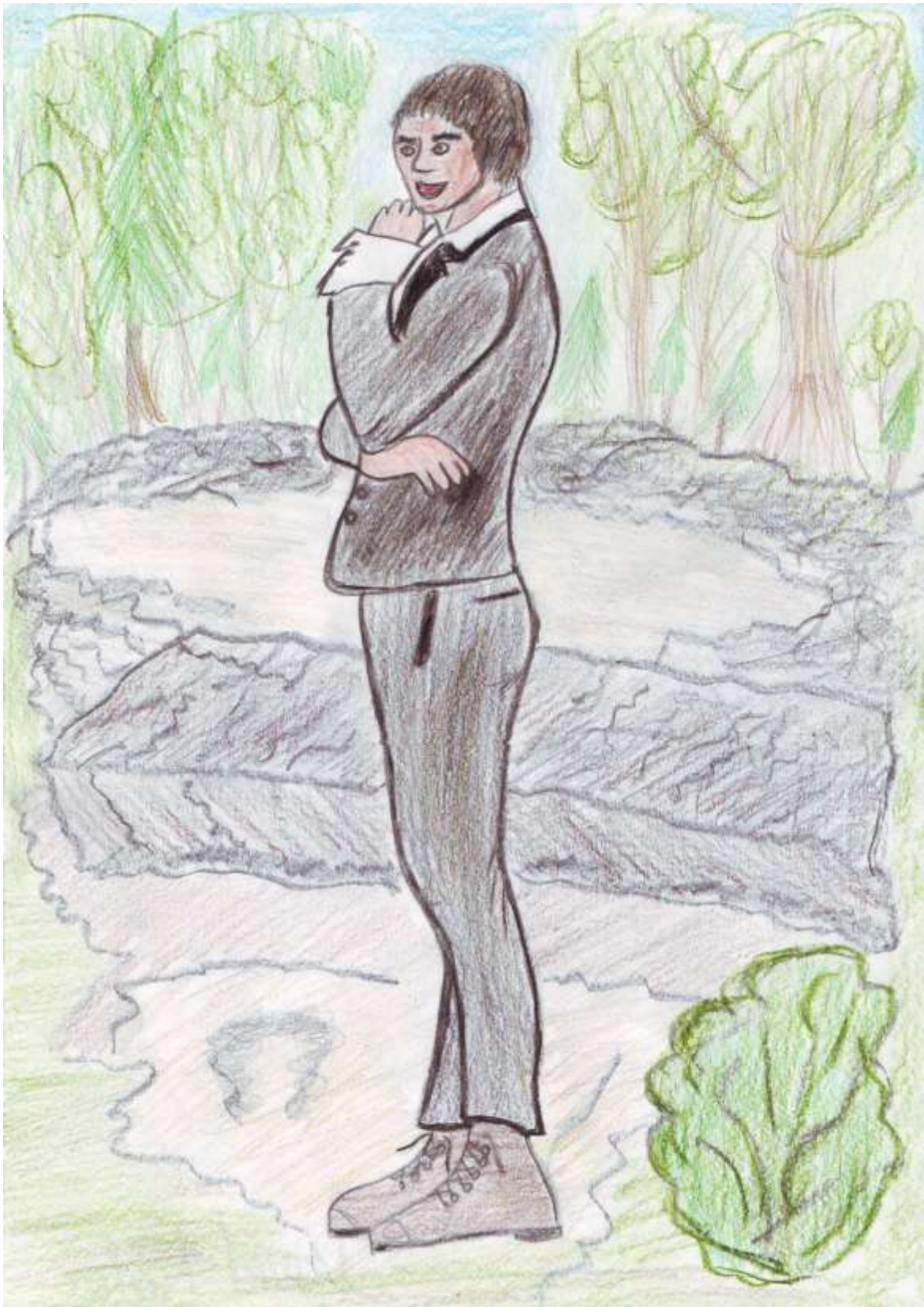
Slika 8: Risba Otokarja III. Traungauca kot si ga je zamislil eden izmed avtorjev raziskovalne naloge David Kolar