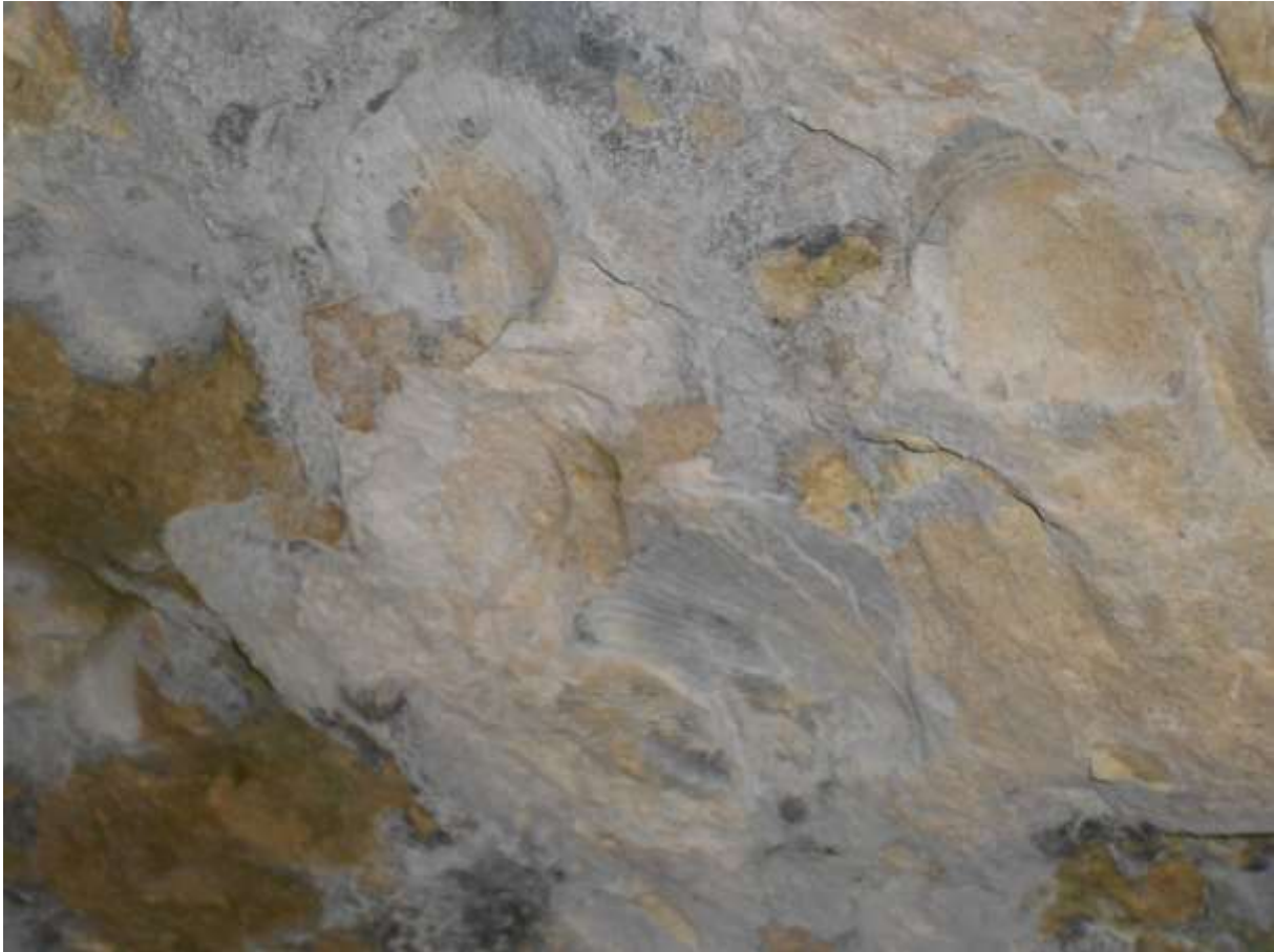
Slika 3: Odtisi školjk v kamnu

Najverjetneje je veliko kamna iz Homca uporabljenega tudi pri gradnji hiš v neposredni bližini in pri gradnji Žičke kartuzije. Z namenom, da si domnevne gradbene materiale iz Votle peči na območju Žičke kartuzije ogledamo na lastne oči, smo se nekaj dni kasneje odpravili tudi tja.