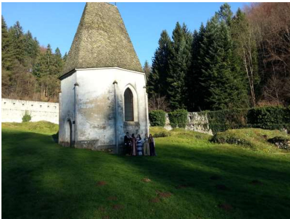
Slika 4: Primož, Zala, Mila, Rebeka in Neja pred kartuzijanskim pokopališčem

Danes kartuzija velja za turistično in kulturno-zgodovinsko znamenitost, ki jo letno obišeče okrog 20.000 obiskovalcev. Ob vhodu stoji Gastuž, najstarejša in zagotovo neizmerno gostoljubna gostilna na Slovenskem (od leta 1467), ki v svoji zbirki hrani tudi srednjeveške kuharske recepte.