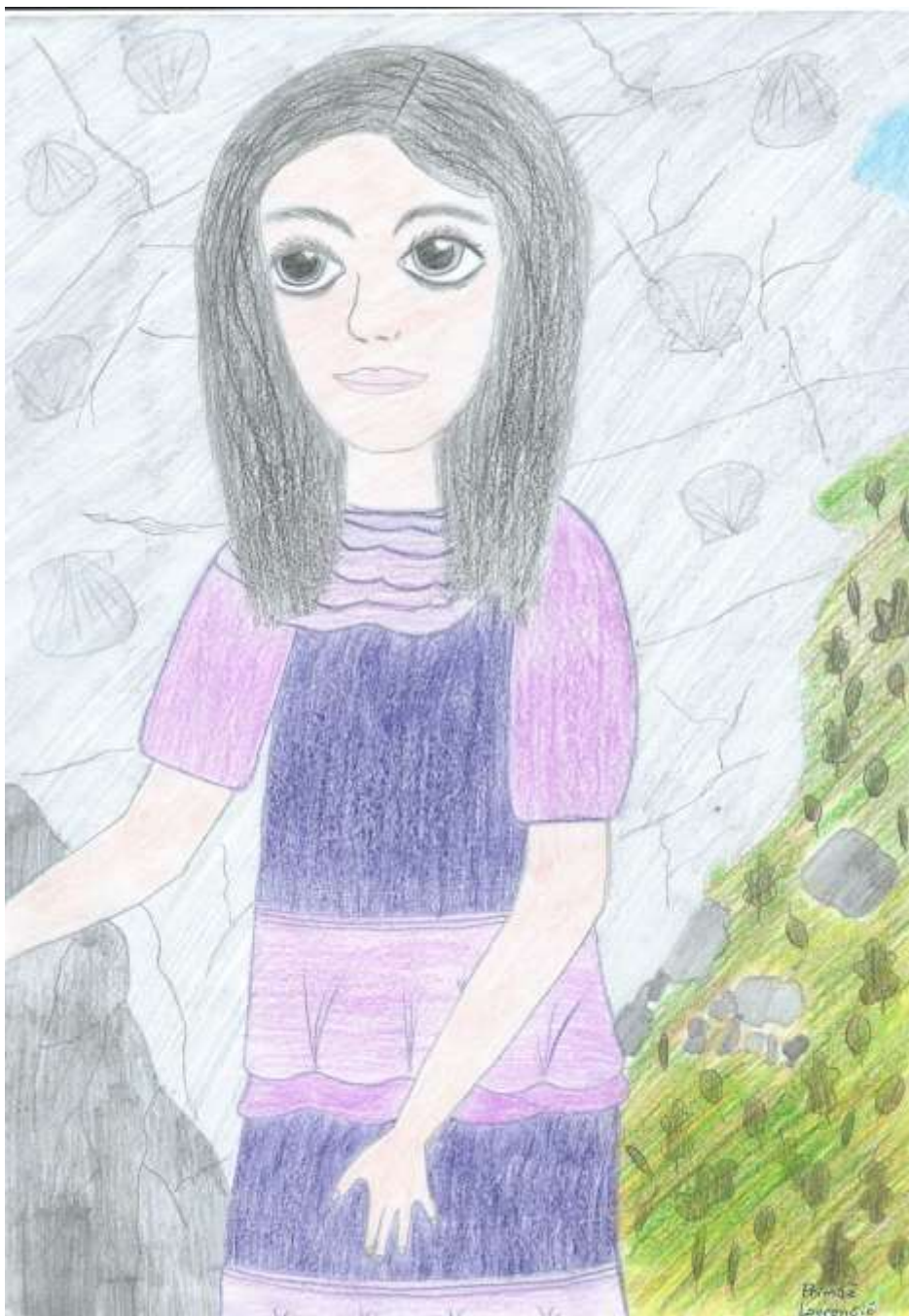
Slika 7: Risba Kunigunde von Vohburg kot si jo je zamislil eden izmed avtorjev raziskovalne naloge Primož Lovrenčič

Po smrti moža Otokarja III. leta 1164, ki je umrl na vojaškem pohodu na Madžarsko, je odšla v samostan v Admont (danes na avstrijskem Štajerskem), kjer je dvajset let služila kot nuna. Kdaj je bila rojena ni znano, vemo le, da je umrla 22. novembra 1184 v tem samostanu.