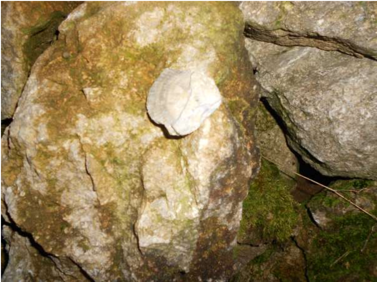
Slika 2: Ostanke školjk v Votli peči

Ob videnju zanimive, visoke previsne stene, smo na njej opazili tudi številne fosile školjk in njihove odtise.